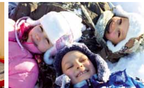
Kinderspielwelt (ca. 80m 2 )