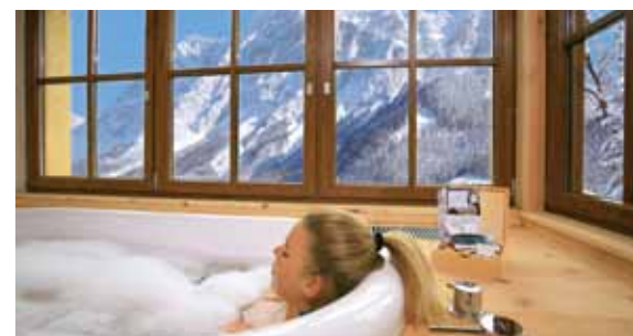
Suite Superior mit Zugspitzblick