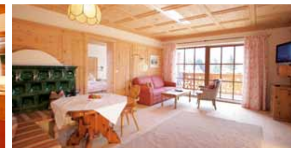
Alpine Wellness-Suite Superior