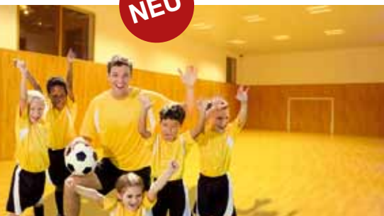
Confetti Multifunktionshalle (ca. 120m 2 )